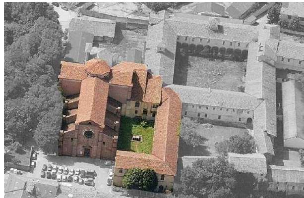
TECNICO EDILE SPECIALIZZATO PER IL CANTIERE PER IL RESTAURO E CONSERVAZIONE DELLE SUPERFICI DI PREGIO DELL'EDILIZIA STORICA